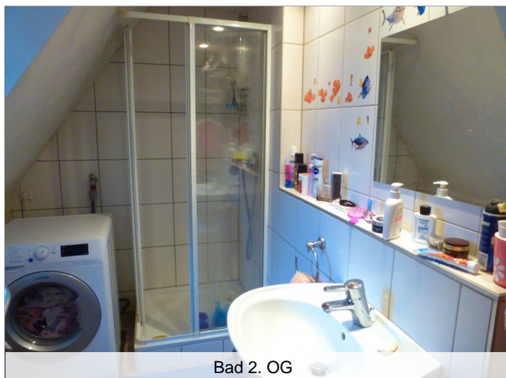
Bad 2. OG