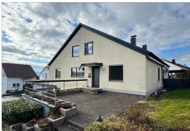
Hauseingang und Freisitz