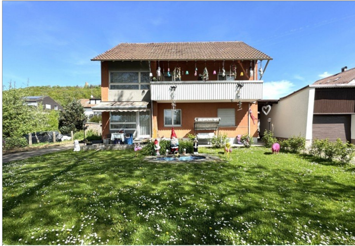
Ansicht und Garten