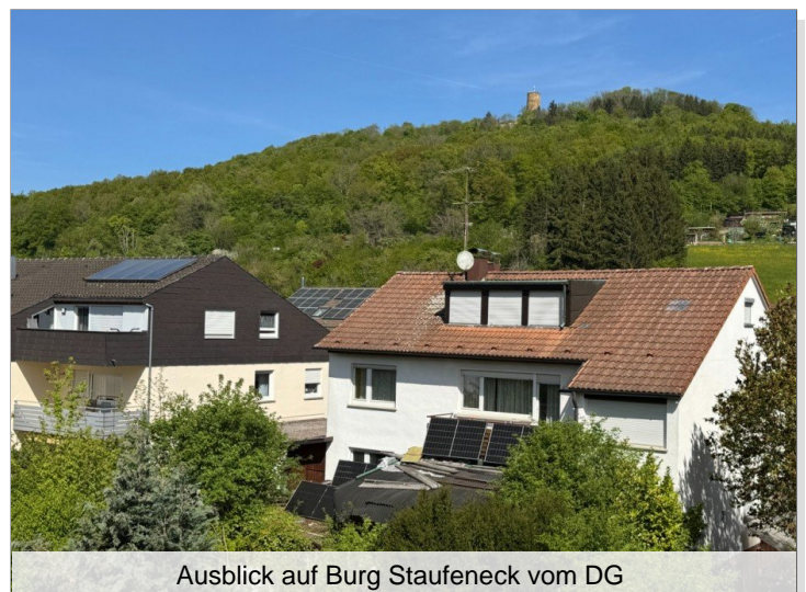
Ausblick auf Burg Staufeneck vom DG