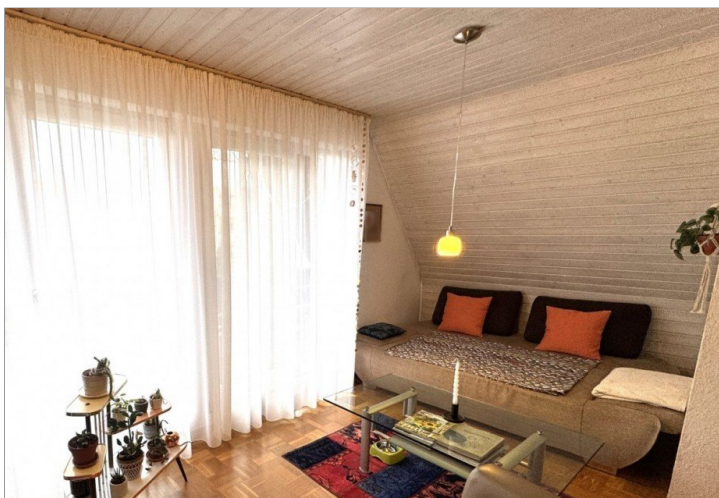
Schlafen / Wohnen DG