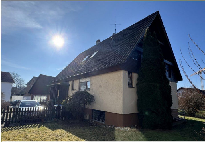
Ansicht und Garten