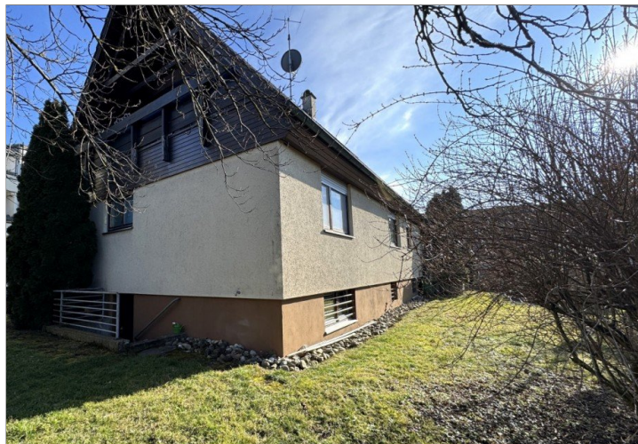
Ansicht und Garten