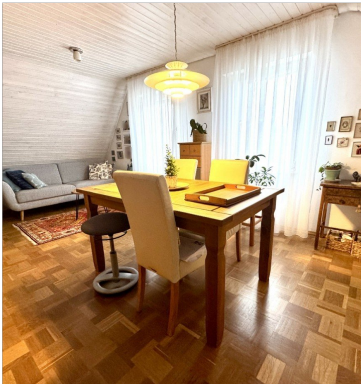
Wohnen / Essen DG