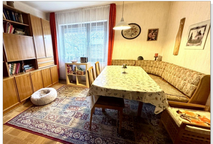
Kind / Essen EG